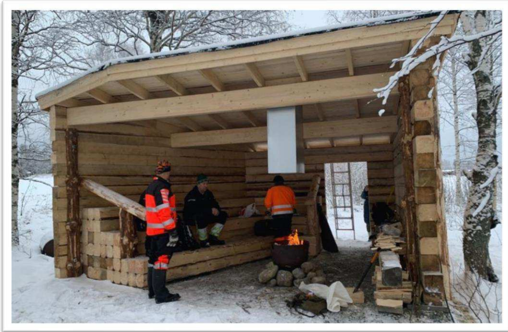
Muurasjärveläisten laavu valmiina käyttöön.

Hankkeilla oli vaikutusta tilojen ja paikkojen esteettömyyteen ja turvallisuuteen. Muurasjärven laavu on rakennettu esteettömän luontopolun varrelle ja Kymönkoskella rakennettiin invaluiska seurantalolle.