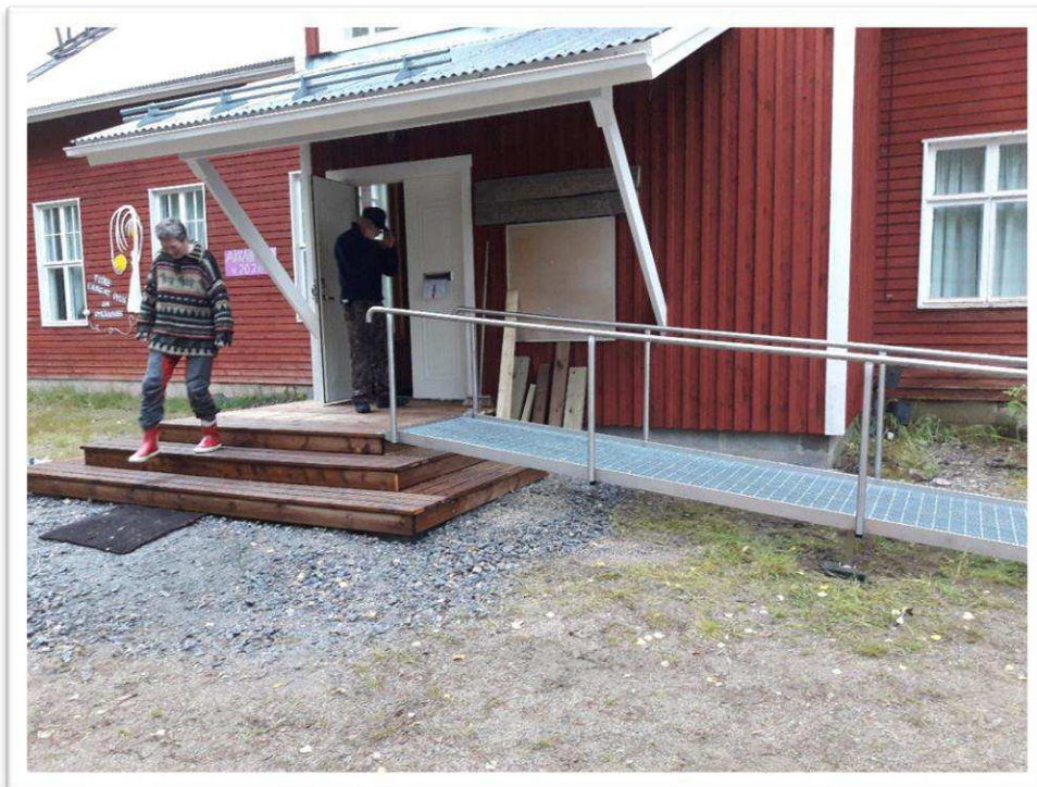
Kymönkosken seurantalolle saatiin invaluiska.