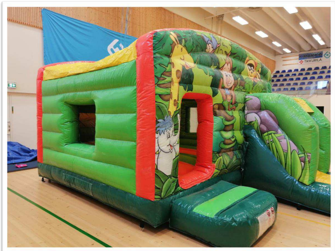
Pomppufiiloksen tuoja Kyyjärvellä.