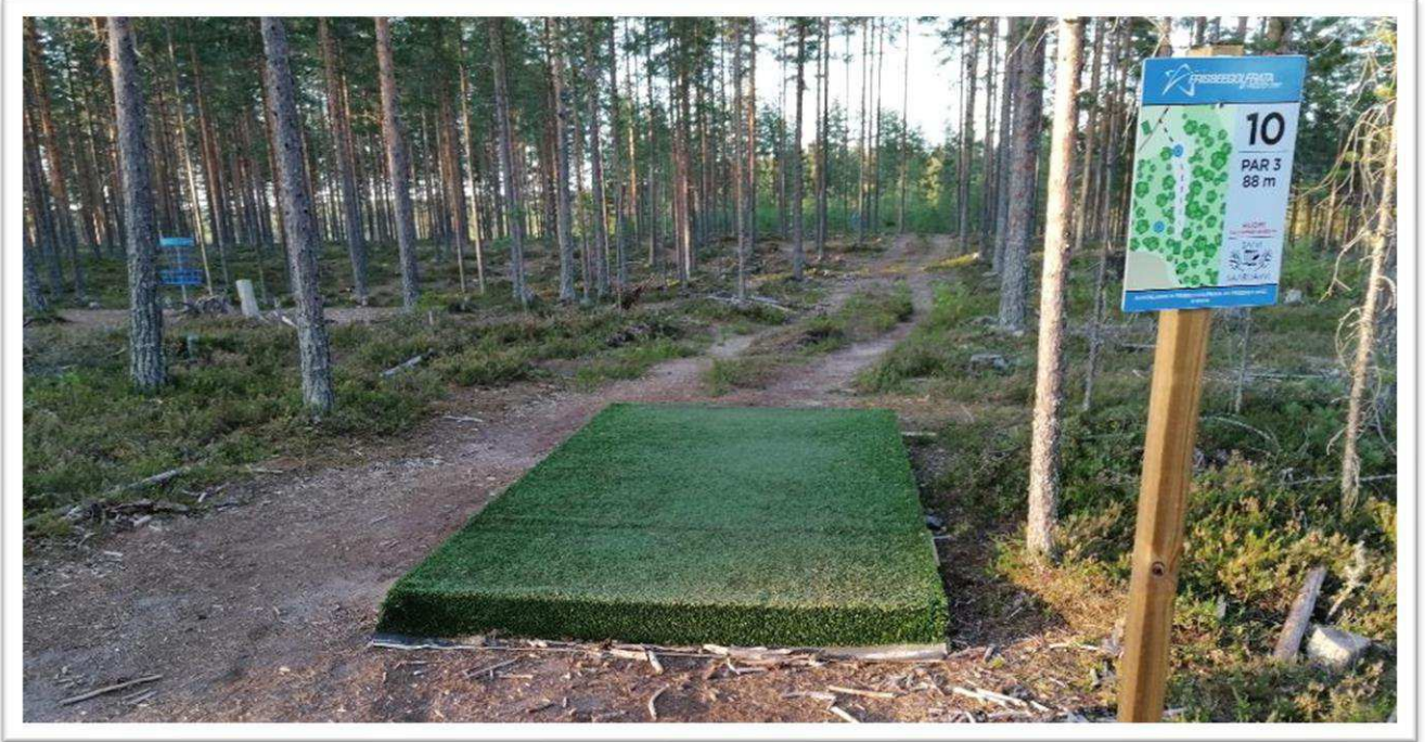
Ahvenlammen frisbeegolfradan uusi heittopaikka ja opaste.