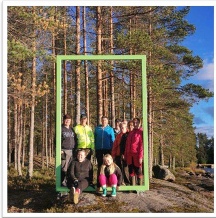
Pyökkösten aktiivisia talkoolaisia Papinkalliolla.

Pienet hankkeet ovat erittäin tärkeitä toteuttajille. Ihmisten ylpeys omista aikaansaannoksistaan oli huomattava – ja aivan syystäkin ylpeyttä omaan tekemiseen oli. Pienellä panostuksella saadaan aktivoitua kylien asukkaita yhteisen hyvän eteen ja yhteisöllisyyden lisääntyessä myös toiminta lisääntyy ja ollaan positiivisesti pyörivän kehän ytimessä.