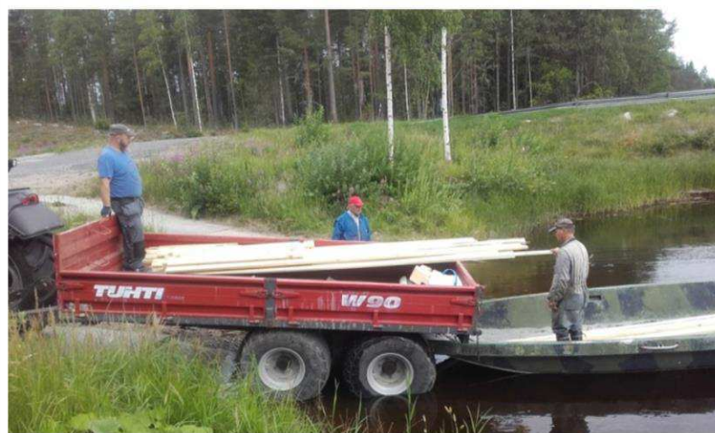
Rakennusmateriaalien rahtaaminen saariin vaati erikoiskalustoa ja kustannuksia.

Retkeilijöiden, kalastajien ja matkailijoiden iloksi Vuosjärvellä kunnostettiin rantautumispaikkojen rakennelmia kolmessa eri saassa. Muurasjärven laavulla on ollut käyttäjiä heti valmistumisesta lähtien, laavu edistää myös koululaisten luonto- ja retkeilymahdollisuuksia. Papinkallion virkistysalue Pylkönmäellä on kerännyt käyttäjiltään kiitosta ja alueen kehittämistä on jatkettu myös hankkeen jälkeen aktiivisesti.