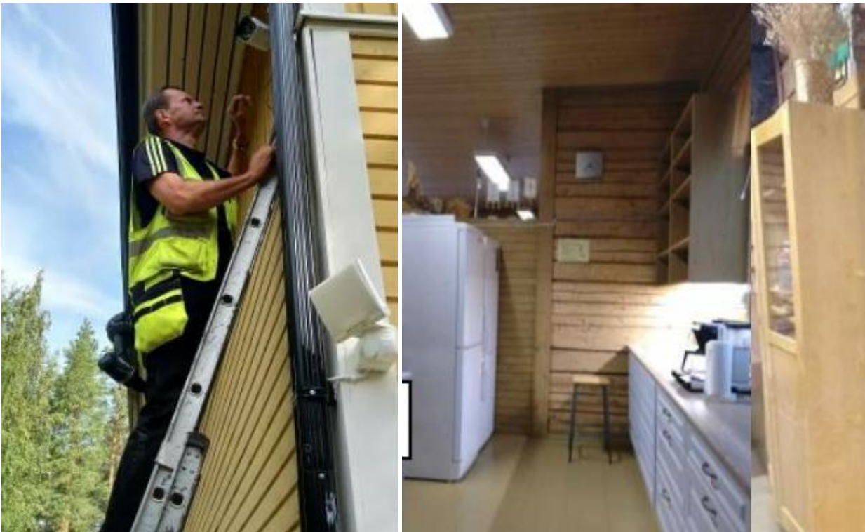
Kameran asennusta ja keittiön uudistusta.

Ilosjoen kyläseura hankki kameravalvonnan, jää-pakastinkaapin, suihkukaapin ja komerotilaa Tahkontuvalle. Hankinnat parantavat kylätalon toimivuutta, siisteyttä ja estetiikkaa sekä lisäävät houkuttelevuutta erilaisten tapahtumien järjestyspaikkana.