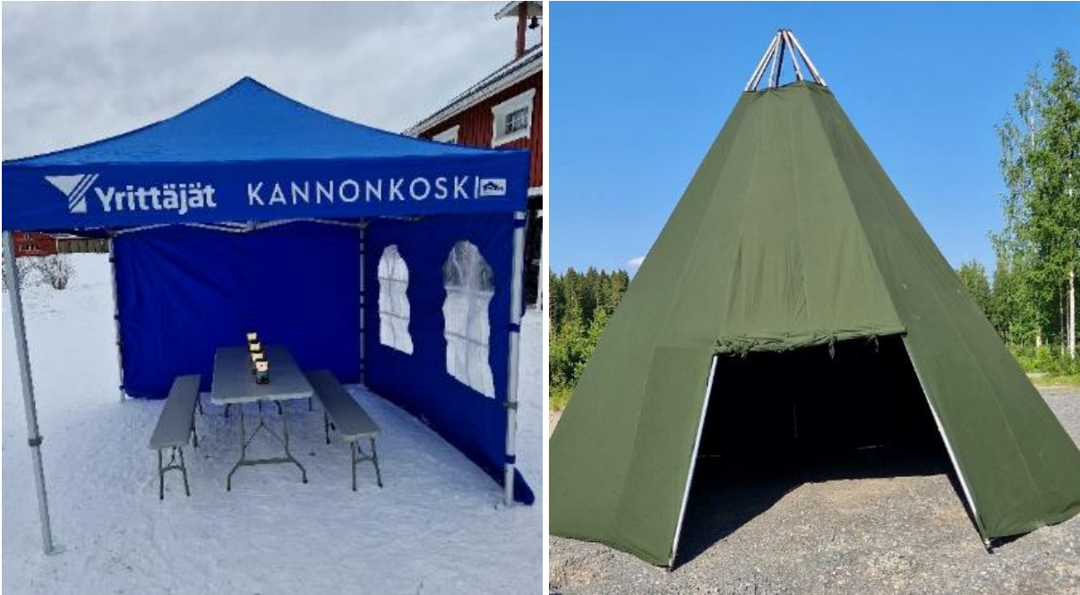
Pop-up teltta ja kunnostettu kota

Kannonkosken Yrittäjät korjasivat yhdistyksen siirrettävää kotaa sekä hankkivat pop-up teltan kalusteineen. Hankinnat paransivat yhdistyksen kaluston tasoa ja käytettävyyttä ja siten helpottaa tapahtumien järjestämistä.