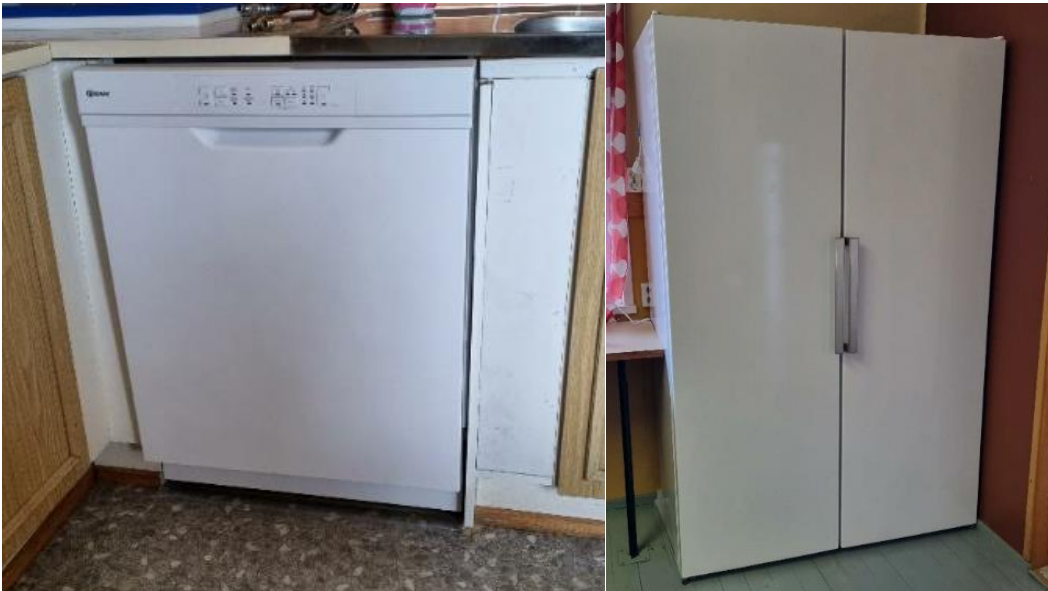
Astianpesukone ja jääkaapit

Konginkankaan Kyläyhdistys hankki Kylätalolle astianpesukoneen, mikroaaltouunin sekä kaksi jääkaappia. Hankinnat parantavat varustelutasoa ja siten lisäävät Kylätalon käyttöastetta. Kylätalo kehittyi kaikkien paikallisten toimijoiden tarpeita parhaalla mahdollisella tavalla palvelevaksi paikaksi.